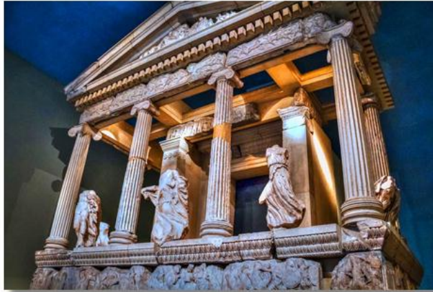
Cultural Agenda Setting: Greek Museums